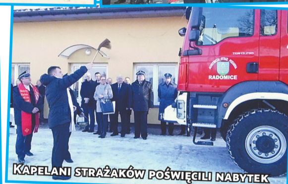
KAPELANI STRAŻAKÓW POŚWIĘCILI NABYTEK