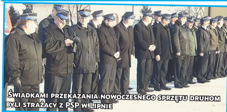
ŚWIADKAMI PRZEKAZANIA NOWOCZESNEGO SPRZĘTU DRUHOŃ BYLI STRAŻACY Z PSP W LIPNIE